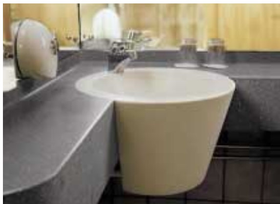
RADISSON SAS ROYAL VIKING HOTEL, STOCCOLMA, SVEZIA. DESIGN SNICKARBOLAGET. TOP E LAVABO IN CORIAN® CAMEO WHITE E CORIAN® GRAY FIELDSTONE.