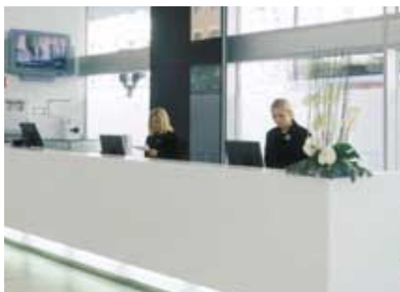
NORDIC LIGHT HOTEL, STOCCOLMA, SVEZIA. DESIGN SJÖÖ FABRIKS. BANCONI RICEVIMENTO IN CORIAN® CAMEO WHITE.

Si tratta di una scelta logica per l'inerte igiene e funzionalità, per l'eleganza e la flessibilità progettuale. Ma Corian® si apre anche a nuove dimensioni in combinazione con altri materiali e anima l'ambiente con un'atmosfera unica, in ambienti raffinati e originali in cui eleganza e comfort trovano un equilibrio perfetto.