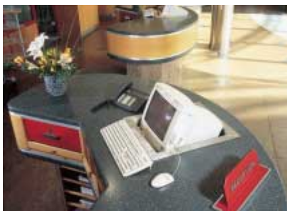
MÖVENPICK HOTEL, OBERURSEL, GERMANIA. TRE BANCONI RICEVIMENTO ARROTONDATI IN CORIAN® RAIN FOREST COMBINATO CON IL LEGNO.