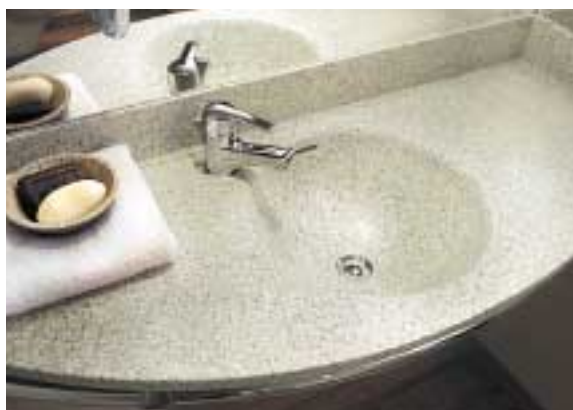
NOVOTEL, ROTTERDAM, PAESI BASSI. UN LAVABO "TUTTO IN UN PEZZO" IN CORIAN® PYRENEES.

Funzionale, solido e non poroso, Corian® presenta impeccabili standard igienici. Così facili da pulire, i top e lavabi sembrano creati in un unico pezzo di Corian® grazie a giunzioni praticamente invisibili.