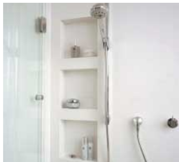
RIVESTIMENTO PARETI IN CORIAN® CON POGGIA OGGETTI INCORPORATI. DESIGN CHARLES ZÁCH.