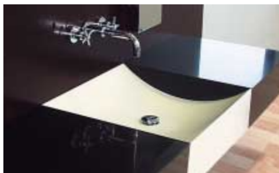
LAVABO "ZEN", MILANO, ITALIA. DESIGN MASSIMO FUCCI. LAVABO IN CORIAN® NOCTURNE E CORIAN® BONE.

Inoltre Corian® si combina magnificamente con legno, acciaio o vetro per dare vita a creazioni originali. Una doccia rivitalizzante o un bagno rilassante diventano esperienze indimenticabili grazie a Corian®.