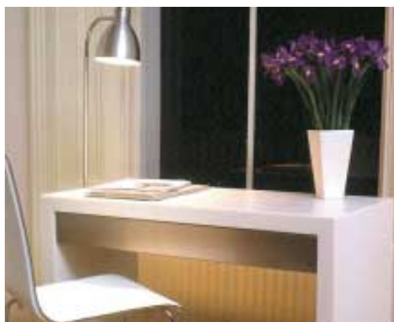
"TABLESTORE", LONDRA, REGNO UNITO. DESIGN ADRIAN WRIGHT. LA BRILLANTE SLAB COLLECTION IN CORIAN® GLACIER WHITE.