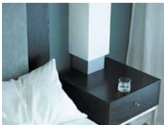
COMODINO IN CORIAN® NOCTURNE.

Un comodino, un tavolino e un poggia valige rivelano linee chiare e raffinate mentre un elegante elemento a ripiani si adatta perfettamente a un angolo angusto.