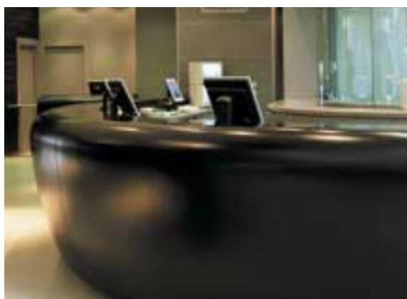
INGRESSO DEL LAGUNA PALACE HOTEL, MESTRE, ITALIA. DESIGN STUDIO MARCO PIVA.