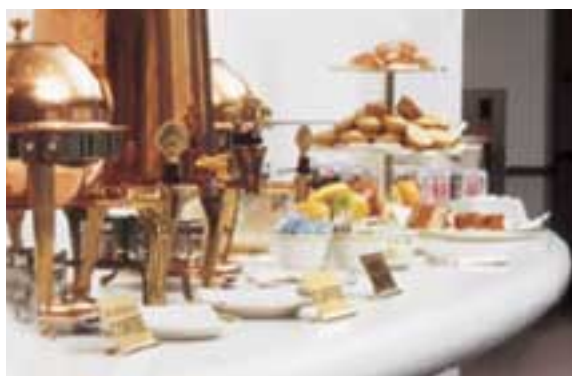
BUFFET IN CORIAN® GLACIER WHITE.

Sullo sfondo, il bar discretamente illuminato contribuisce al relax degli ospiti. In un'atmosfera accogliente e felpata, i colori audaci della superficie in Corian® riflettono quelli dei cocktail preparati dal barman. Chiacchiere informali, confidenze, gli ultimi dettagli di una trattativa commerciale: un mondo che gira e rigira intorno ai tavolini in Corian®. E nulla – né un cocktail versato, né un mozzicone dimenticato – potrà deturpare la bellezza e l'eleganza.