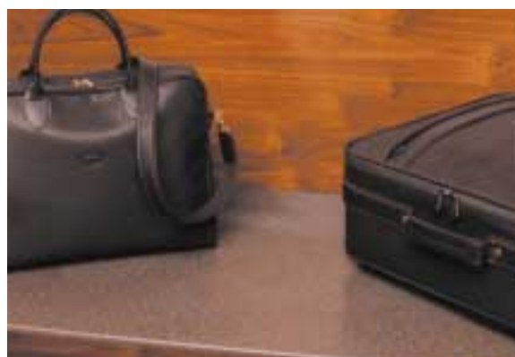
POGGIA VALIGIE IN CORIAN® CANYON.