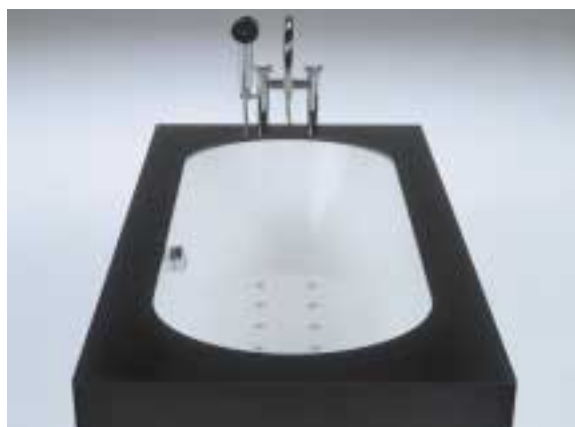
"ECLETTICO PLUS", ITALIA, DESIGN F. GECELE, MAKRO DESIGN. RIVESTIMENTO ESTERNO VASCA IN CORIAN® NOCTURNE.