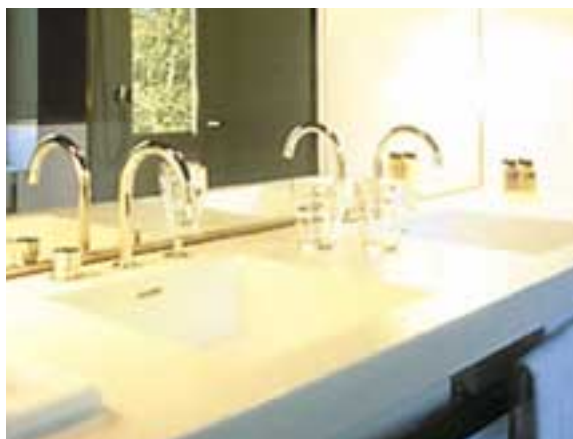
"THE HOTEL", LUCERNA, SVIZZERA. DESIGN JEAN NOUVEL. TOP E LAVABI IN UN UNICO PEZZO IN CORIAN® GLACIER WHITE.